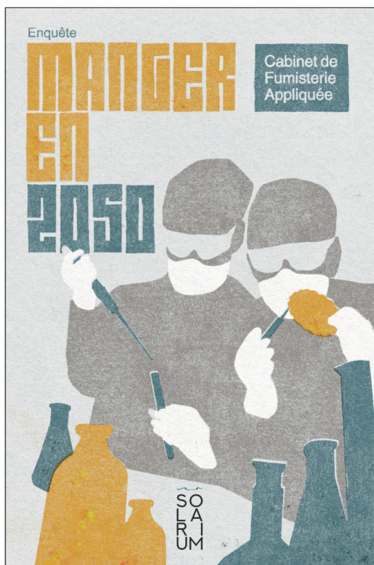
Couverture et illustrations : Bruno Nazarko