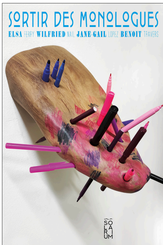
Couverture : Romain Rambaud